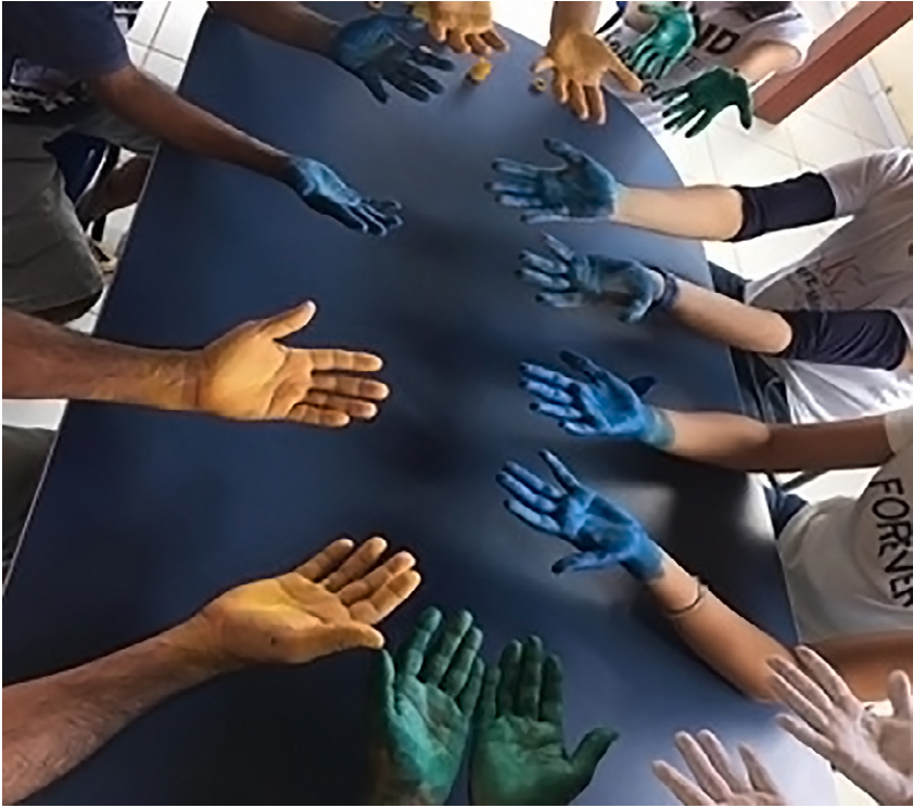
Figura 1 – Dinâmica “Pintando o certo”. Iguatu-CE, Brasil, 2020