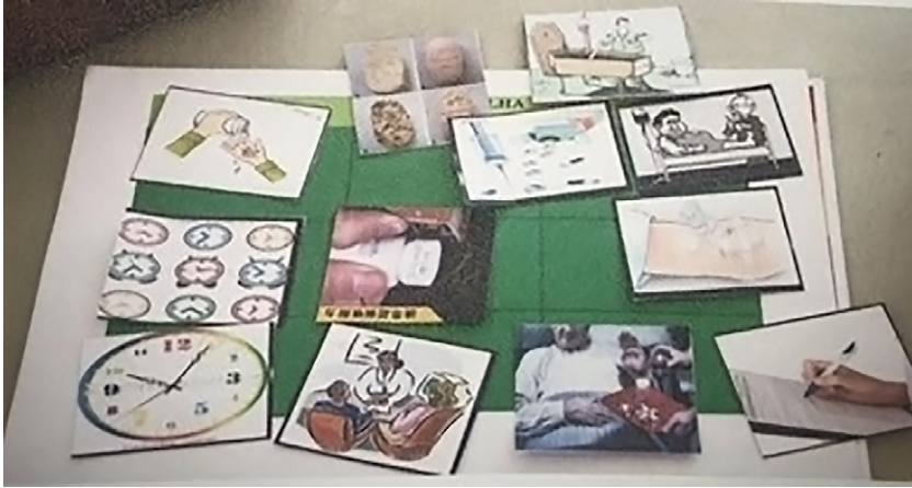
Figura 1 - Jogo educativo “Dinâmica dos erros”. Iguatu-CE, Brasil, 2018