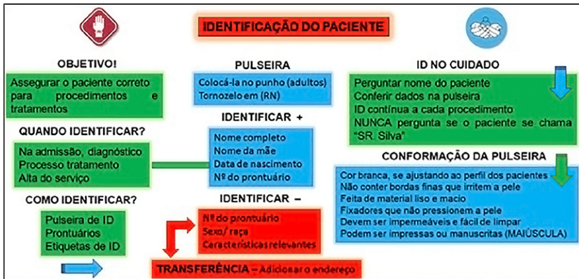
Figura 1 – Fluxograma “Identificação do paciente”