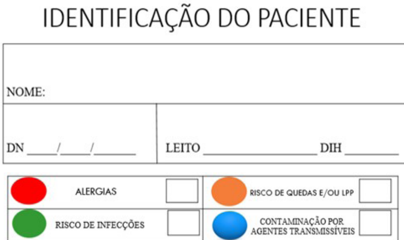
Figura 1- Placa de Identificação. Iguatu-CE-Brasil, 2020

As placas foram plastificadas, assim podem ser reutilizadas por outros pacientes no mesmo leito e com isso diminuir o custo financeiro, para tanto é preciso o uso de pincel atômico não permanente que pode ser apagado com solução alcoólica.