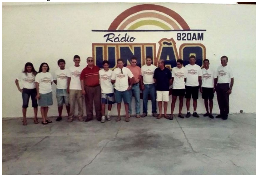
Figura 6: Funcionários da Rádio União de Camocim (1990).