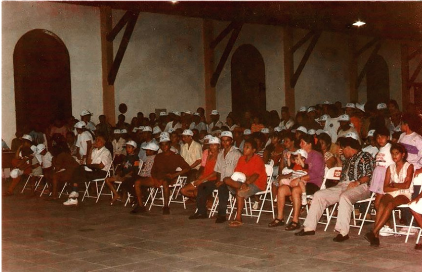
Figura 5: Público presente em uma das edições do Festival de Violeiros de Camocim. S/d.