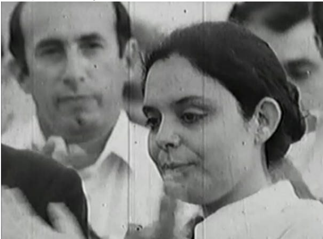
Figura 10 - Fotograma extraído do filme Allende, meu avô Allende

Foi curioso pois Maya me mostrou uma foto de mim com Tati [...] Eu nunca tinha visto uma foto minha com Tati. Ela tinha uma expressão doce que eu nunca tinha visto nela. A imagem dela mais fechada é só uma parte. Uma pequena parte dela, eu diria. Ela podia até ser valente, atrevida, alda, decidida... Mas Tati era muito sensível.