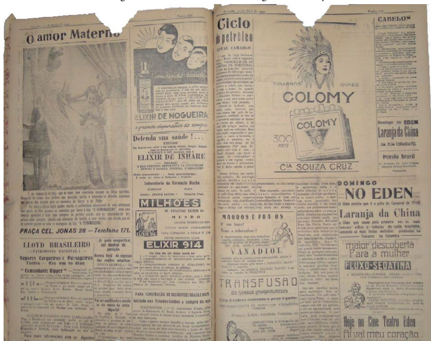
Figura 1 - Amor materno versus cigarros Colomy