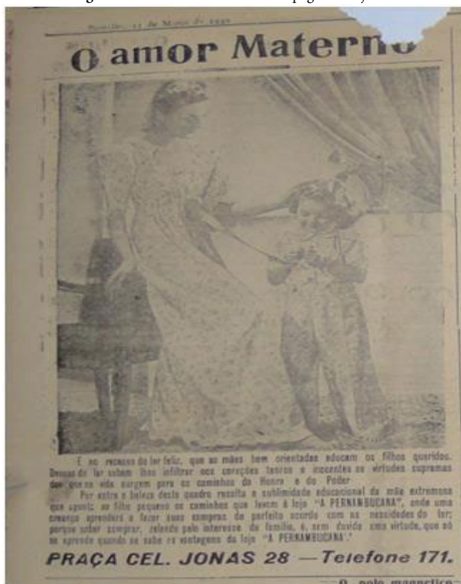
Figura 2 - Amor e maternidade nas páginas do jornal