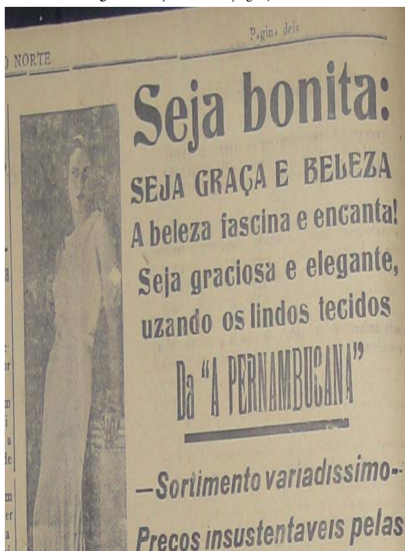
Figura 4 - Seja bonita: seja graça e beleza