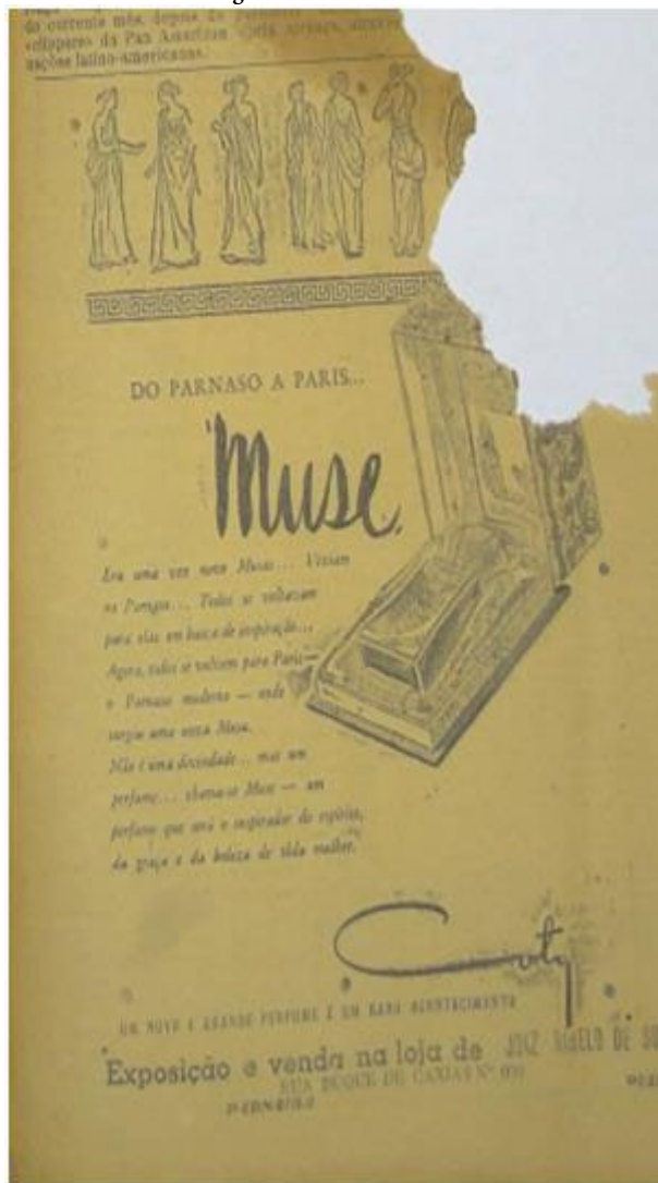
Figura 5 - Perfume Musse